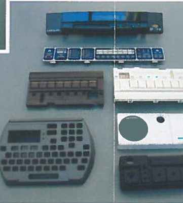
Elektrotechnik stabilisiert, Flammenschutz